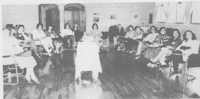
Foi grande o interesse dos presentes pela exposição sobre a Rússia