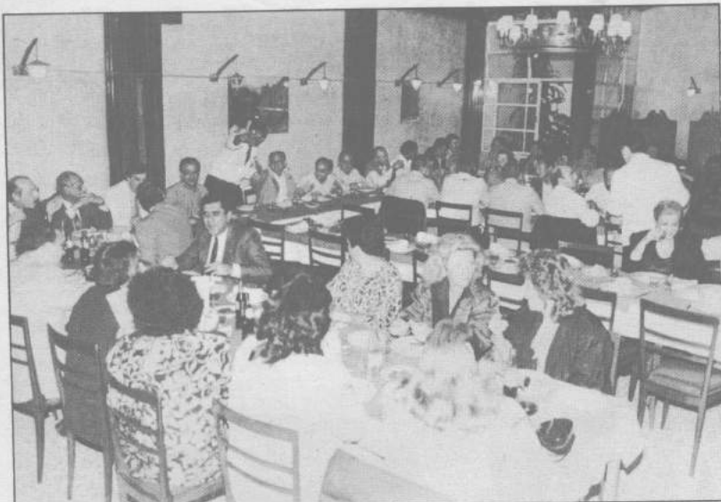
O jantar de conagração, na Cantina La Tavola

♦♦♦ última esperança do sofrido povo brasileiro. Se os demais poderes e as instituições privadas não atendem aos anseios de uma nova ordem de decência, impõe-se que o Judiciário assuma o papel político e tente recuperar o Brasil. Não em tom messiânico, mas enfrentando a dura realidade brasileira, transformando-a.