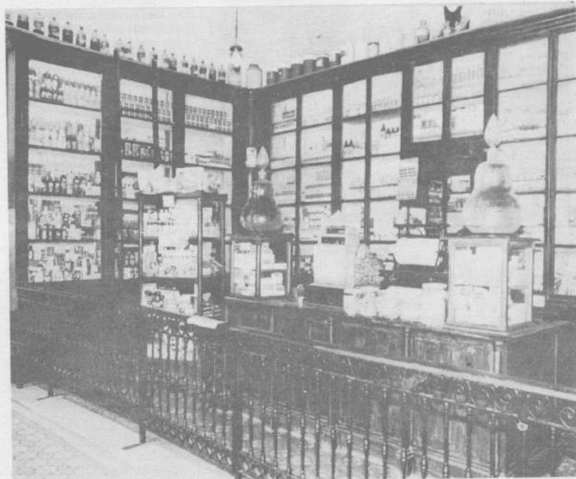
A antiga farmácia e o retrato em um passado muito vivo em Bananal

Adherbal dos Santos Acquatini acha que uma das experiências mais positivas que o magistrado pode encontrar é o relacionamento, são as amizades em todos os níveis que o exercício de suas atividades lhe proporcionam".