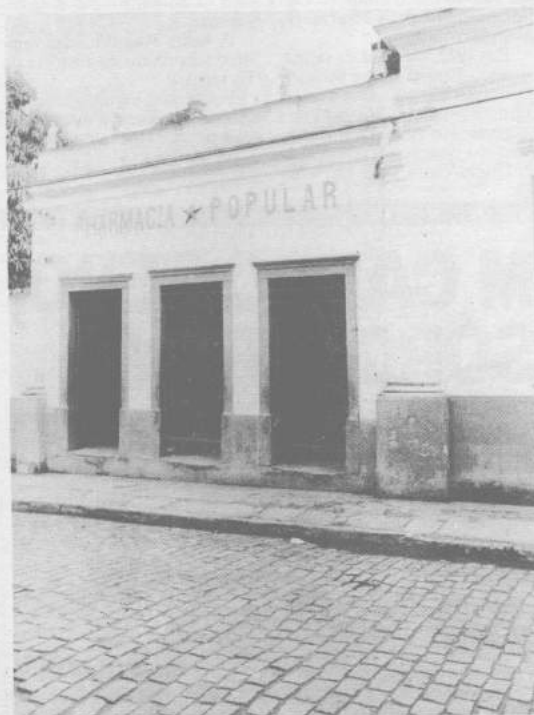
A fachada da Farmácia Popular

esse tipo de Comarca, dificilmente vai conseguir entender uma porção de coisas, como os valores do homem do interior, sua maneira de pensar e de viver, e os diferentes tipos de pessoas, fatores estes que podem ajudá-lo muito na hora de tomar e proferir suas decisões;