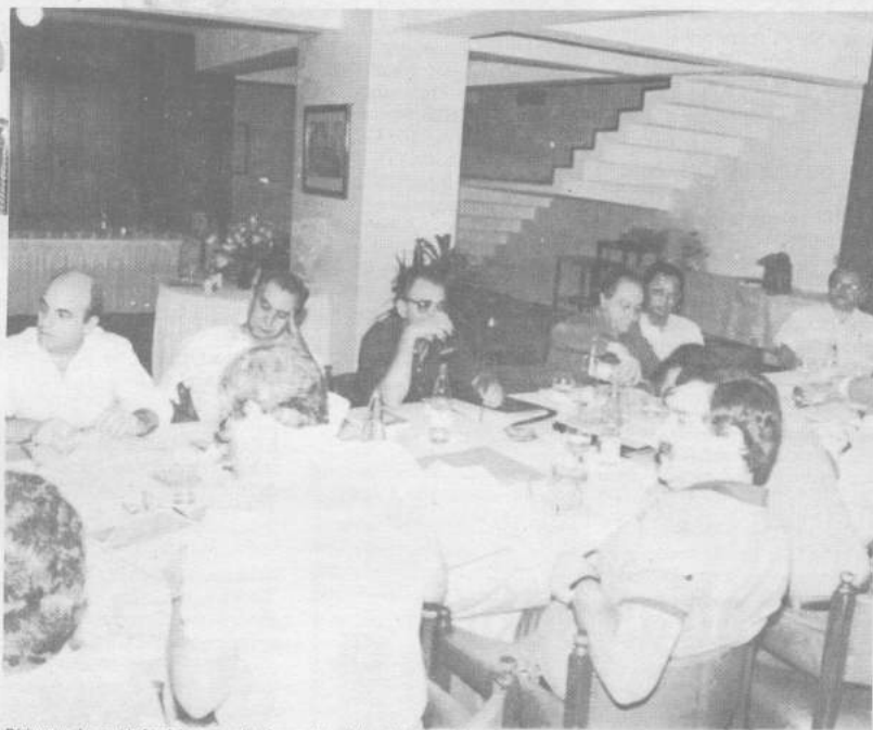
Dirigentes das entidades debatem a plataforma de trabalho da chapa "Novo Brasil", no Hotel Cadore

17 - Participação das associações na banca de concurso de ingresso.