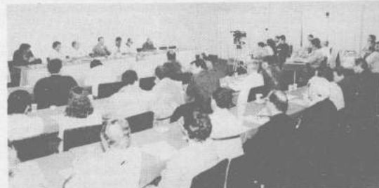
O plenário, no encontro de magistrados em Itu

Bibliografia: Os grandes personagens da História - Editora Abril.