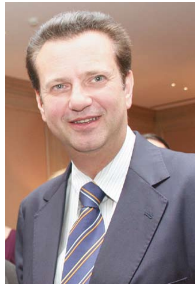
| Prefeito de São Paulo Gilberto Kassab