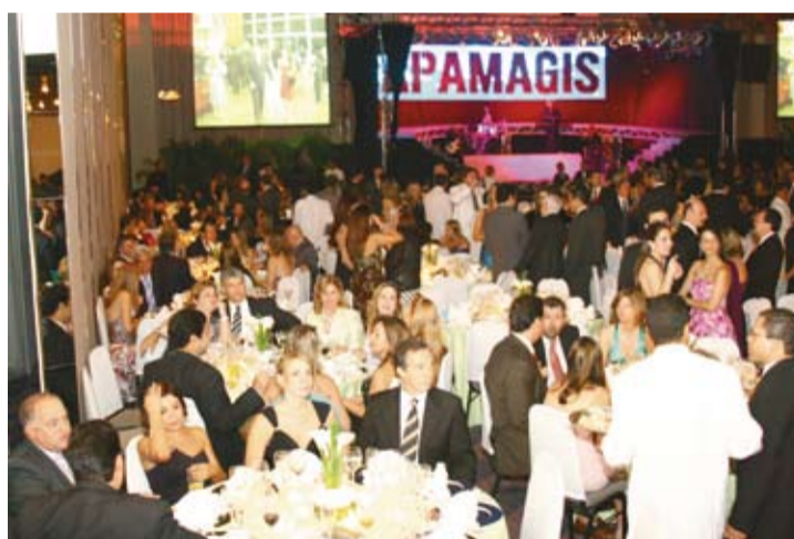
| Mais de 1300 magistrados e convidados