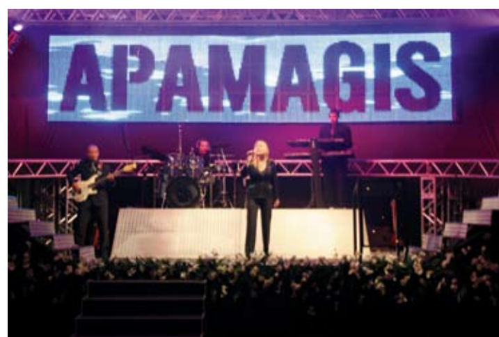
| Banda Nova Era