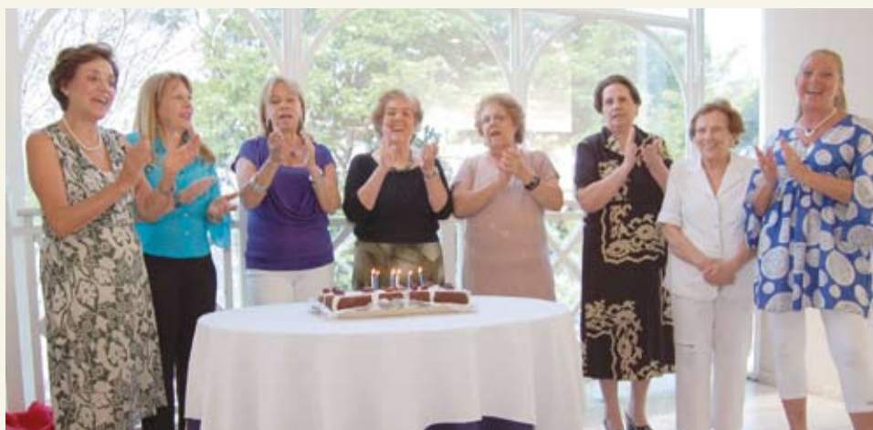
| Aniversariantes comemoram na Sede Social