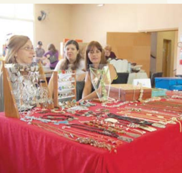
| Arte nas peças de semi-jóias e bijuterias