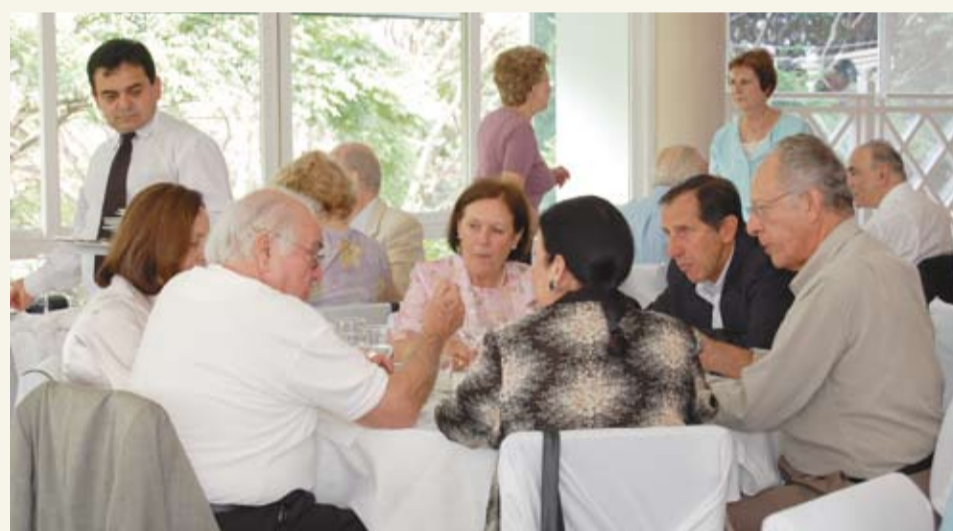
| Confraternização foi a tônica do encontro

A iniciativa objetiva homenagear aos que tanto contribuíram para o Poder Judiciário, prestando relevantes serviços à magistratura e à sociedade em geral. E, também, às pensionistas, que realizam um importante e sério trabalho para garantir os direitos da categoria.