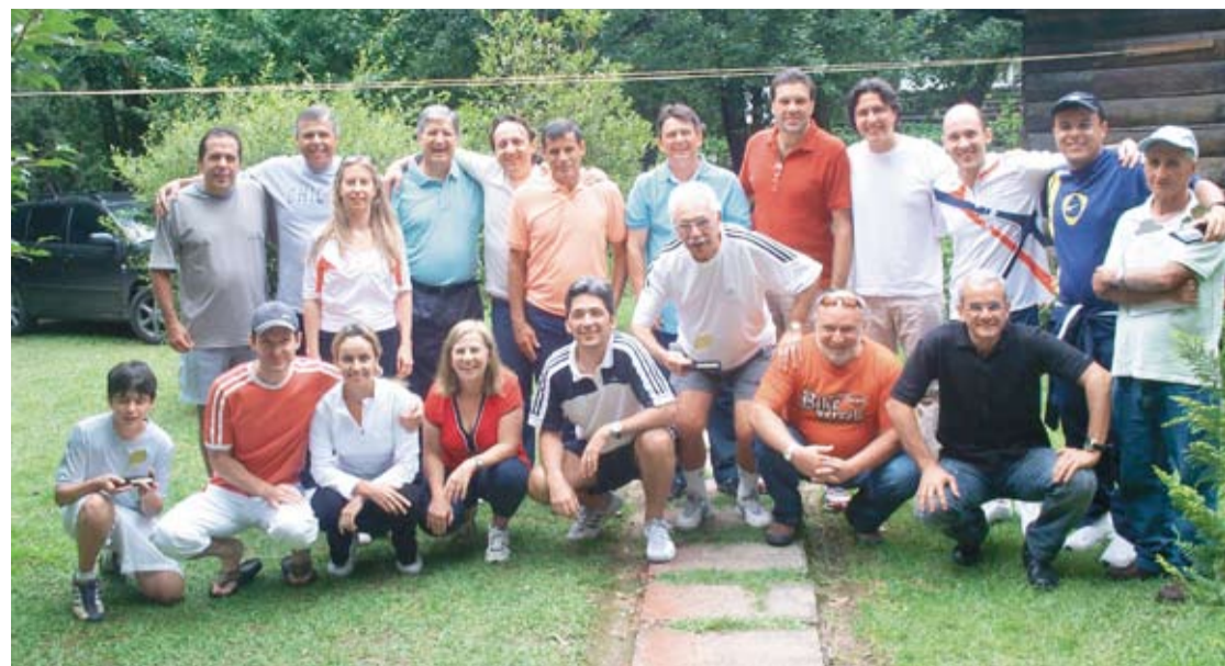
| Magistrados e familiares em momento de descontração

Quase todos magistrados e dependentes ficaram hospedados na Colônia