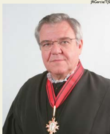
| Ministro Sidnei Beneti

Ao dar as boas-vindas aos novos colegas, o Ministro Raphael de Barros destacou as qualidades profissionais dos novos ministros e suas contribuições para a Justiça Brasileira.