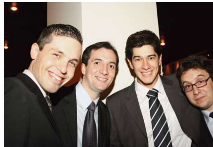
| Jovens magistrados se confraternizam