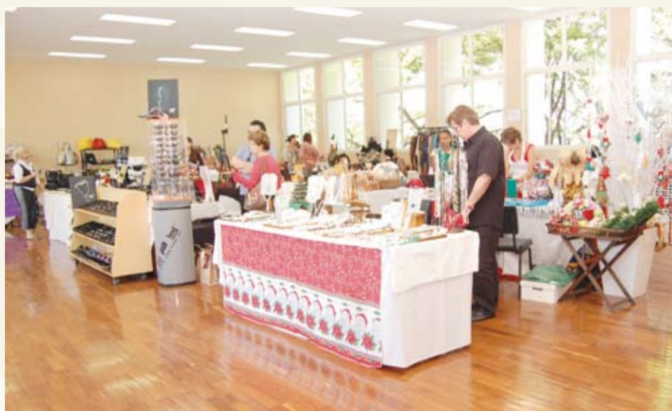
| Diversidade de produtos

O dinheiro arrecadado no bazar será destinado a compra de material para confecção de enxovais que serão doados a mulheres grávidas de baixa renda do Poder Judiciário.