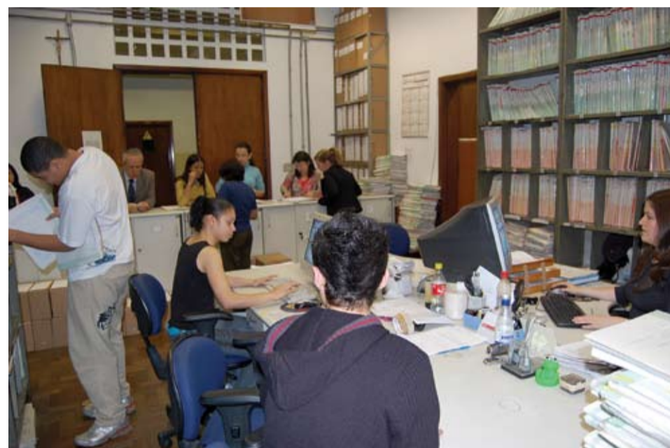
| 20 mil pessoas usufruem diariamente dos serviços oferecidos no João Mendes Jr.

Os dias no Fórum João Mendes Jr. não gozam, de fato, de tranquilidade. No entanto, no dia 31 de maio de 2001, a poluição sonora do edifício deu lugar ao estrondo que vinha do 16º andar, onde houve a explosão de uma bomba que interrompeu os trabalhos forenses do prédio naquela data.