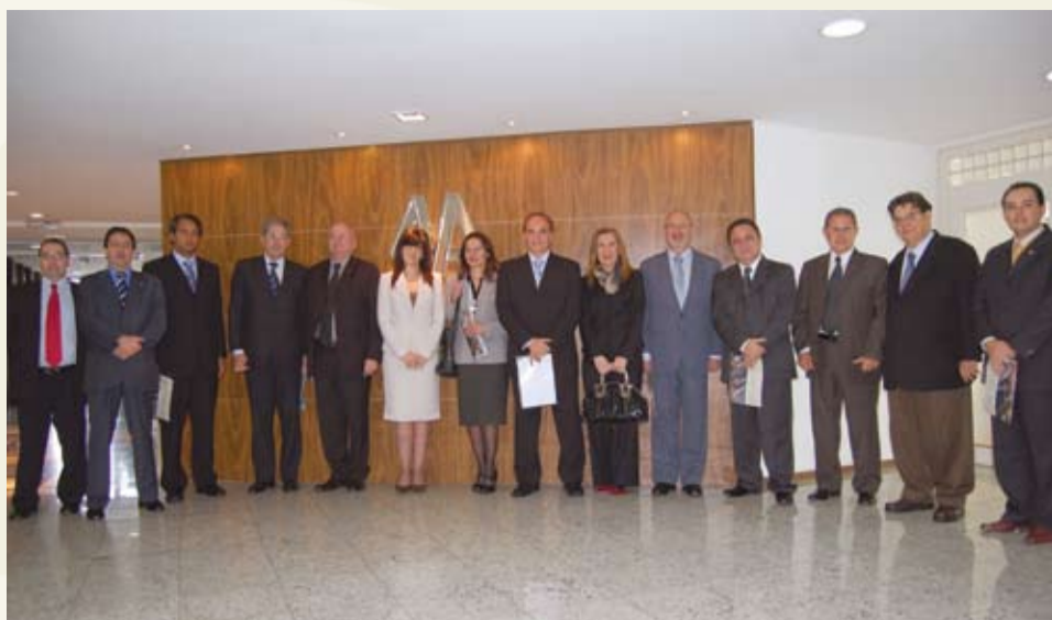
| APAMAGIS recebe visita de membros da Comissão