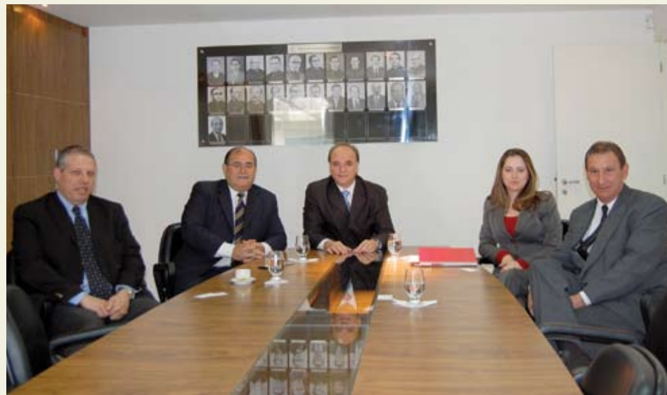
| Diretores da APAMAGIS e integrantes do Santander buscam novas ações para os associados

Na manhã do dia 17 de julho, reuniram-se na sede administrativa da APAMAGIS representantes da Associação e do Banco Santander. O encontro objetivou a ampliação da parceria da Entidade com o Banco.