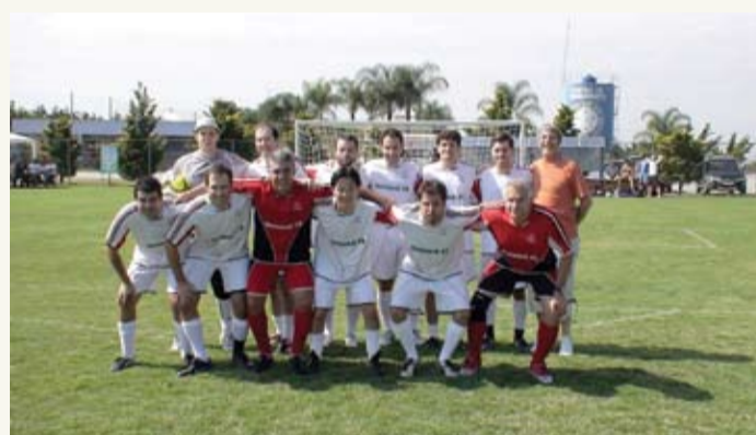
| Equipe Livre