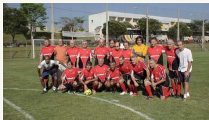
| Equipe Senior