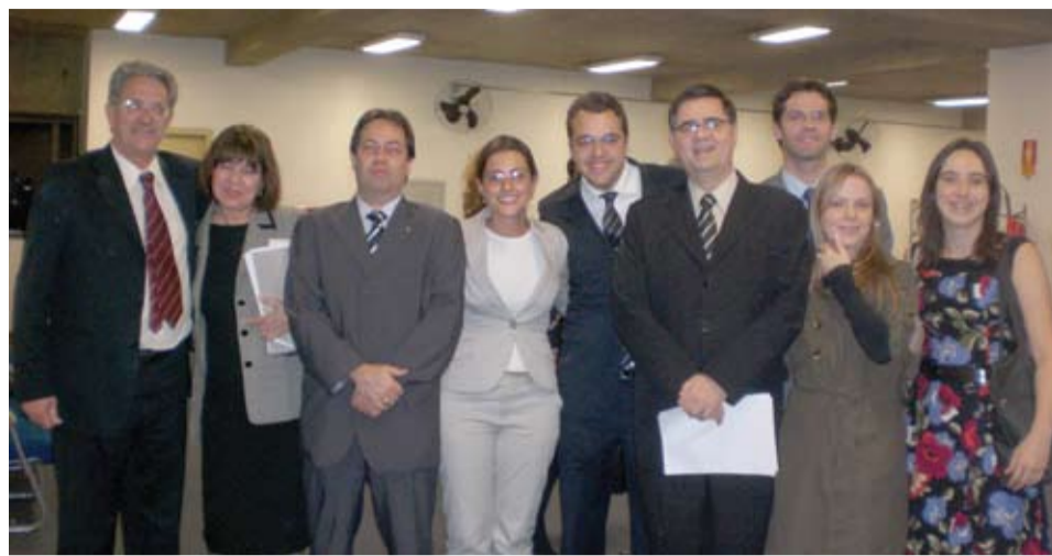
| Magistrados receberam aulas da EPM à distância

Essa é a primeira vez que uma instituição pública de ensino oferece esse