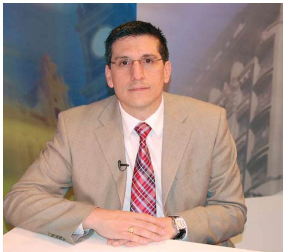
| Deputado José Bruno

JB: Por exemplo, o artigo sexto que diz: recusar, negar, impedir, preterir, prejudicar, retardar ou excluir em qualquer sistema de seleção educacional, recrutamento, promoção funcional ou profissional com pena de