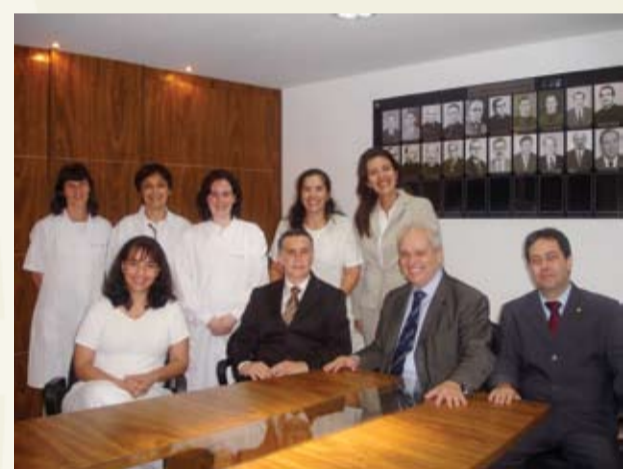
| Diretoria da APAMAGIS se reúne com profissionais de Odontologia

A APAMAGIS, sempre preocupada com a saúde de seus associados e familiares, mantém convênio com AS-SOPREST Odontologia Integrada Ltda., empresa responsável pelos serviços odontológicos (estética, clareamento a laser, prótese, periodontia, ortodontia, odontopediatria, cirurgia e implantes). O atendimento é feito nas dependências das sedes Social e Administrativa de segunda a sexta-feira, das 8h às 19h, e aos sábados, com agendamento. Para contato: 5539-1445, 88447-0744 (Sede Social), 3242-9038 e 8447-0745 (Sede Administrativa).