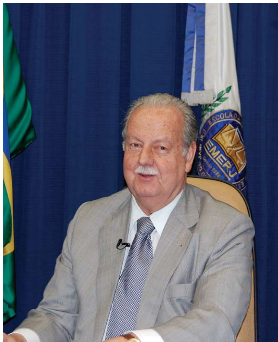
| O Presidente do TJ/RJ explica os benefícios da autonomia

da vara comum. Neste caso, a produtividade do Juiz é boa, mas não é suficiente. Nós estamos procurando controlar e medir, e esta é a importância da informática, porque se eu quiser saber o que produziu o Juiz de uma cidade pequenininha lá do interior do norte fluminense, eu consigo saber. Fica fácil, por exemplo, a Corregedoria saber os dados do Juiz que está trabalhando ou do cartório que está com problema. Nós fazemos a média e se sair do parâmetro, nós podemos intervir com mais segurança. A autonomia financeira e a idéia de gestão nos ajudaram muito. Ainda não estamos onde queremos, mas caminhamos bastante em relação ao passado. Quando não havia autonomia financeira, a questão dos duodécimos era um sacrifício. O Presidente tinha que consultar, freqüentemente, o Governo para requisitar verbas, para requisitar recursos. Às vezes o Governo não tinha, às vezes tinha e não podia ceder por uma questão de outra prioridade. Eu agradeço por ter me tornado Presidente em uma época melhor. E de onde veio esta melhoria? Da sucessão de Presidentes continuando o trabalho realizado em outras gestões. ■