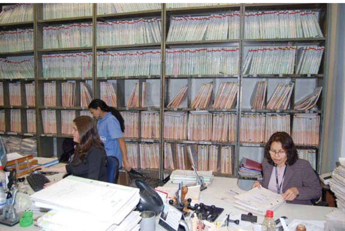
| Funcionários lidam com milhares de processos

“O CAJ é uma sociedade civil formada só pelos Juizes do prédio, que