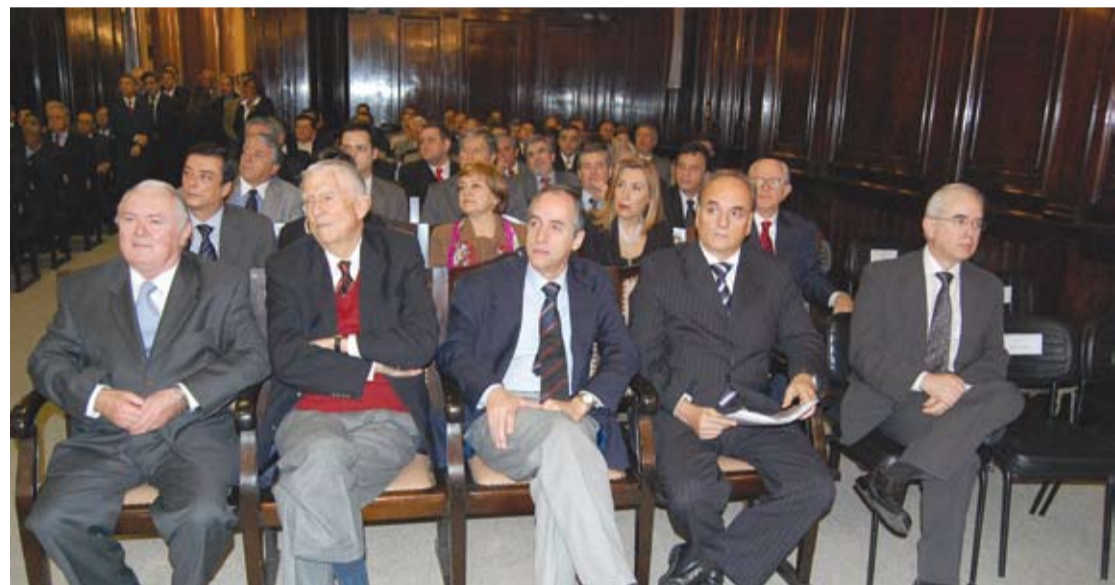
| Autoridades e familiares prestigiaram a posse