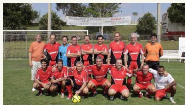
| Equipe Master