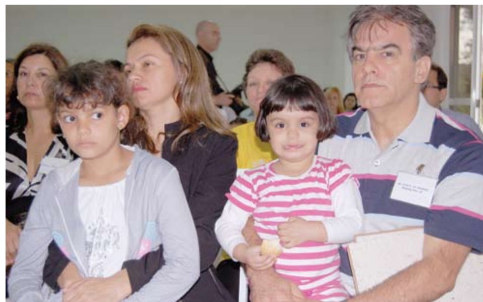
| Associados e familiares se confraternizaram