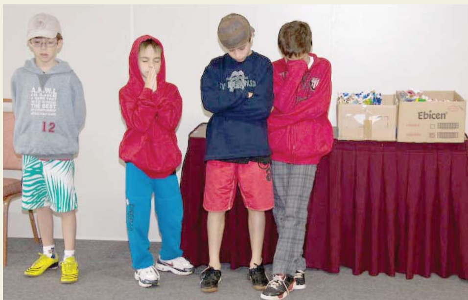
| Crianças participaram ativamente do encontro

Entre os dias 17 e 19 de outubro de 2008, Juizes e Promotores Cristãos estiveram reunidos no Flat Home Green Home, em Campos do Jordão, no encontro denominado Fé e Justiça .