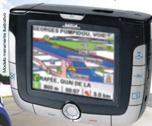
Modelo meramente ilustrativo

Magistrado, chegou mais um benefício exclusivo para quem tem o veículo segurado através da Fontana Seguros: incríveis descontos e condições especiais na instalação de aparelhos de GPS - sistema de localização via satélite com endereços e mapas de várias cidades do mundo.