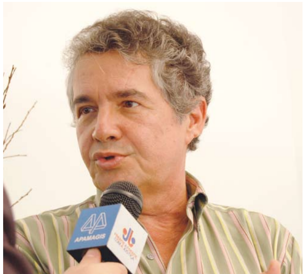
| Marco Aurélio Mello

MA: As mudanças são corretivas, mas na verdade, o que nós precisamos no país é de uma boa educação e a observância o direito alheio, não apostando na morosidade da Justiça, não questionando certas situações, que são claras, apenas para se ganhar tempo. Isso tudo passa, como eu disse, pela educação do povo. Nós só vamos ter