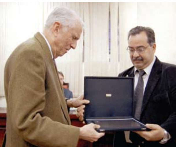
| Poeta Paulo Bomfim recebe homenagem