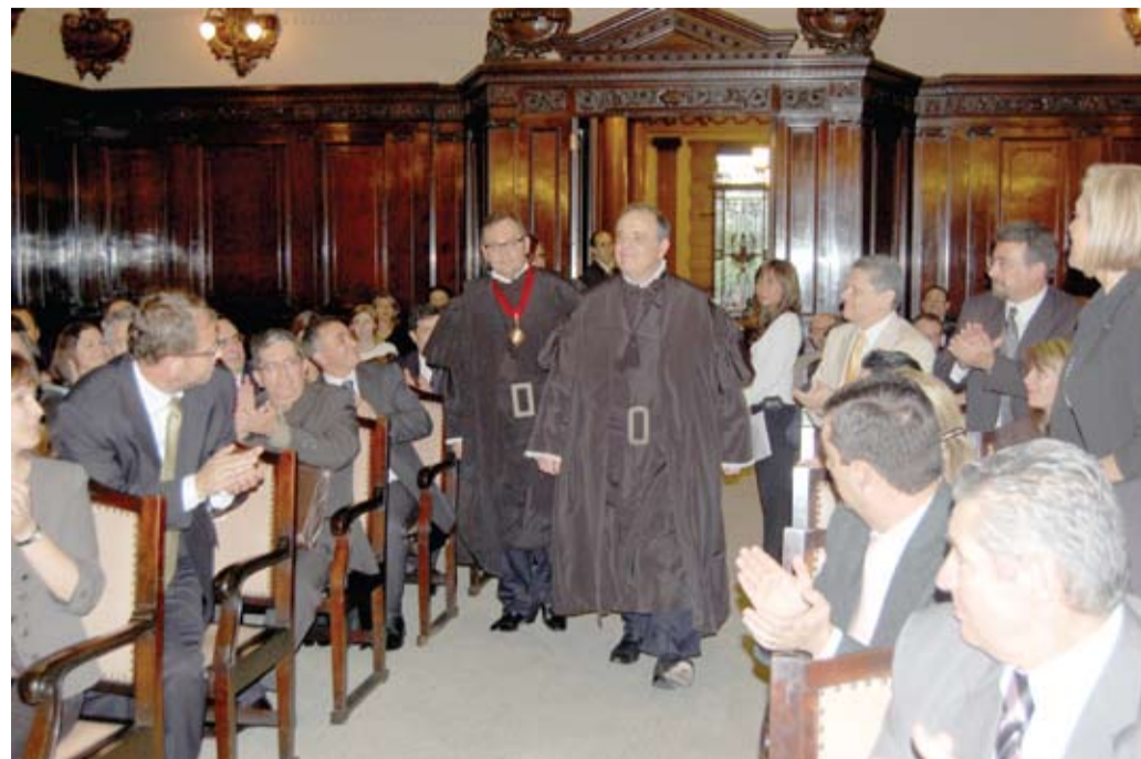
| O novo Desembargador é saudado em sua posse