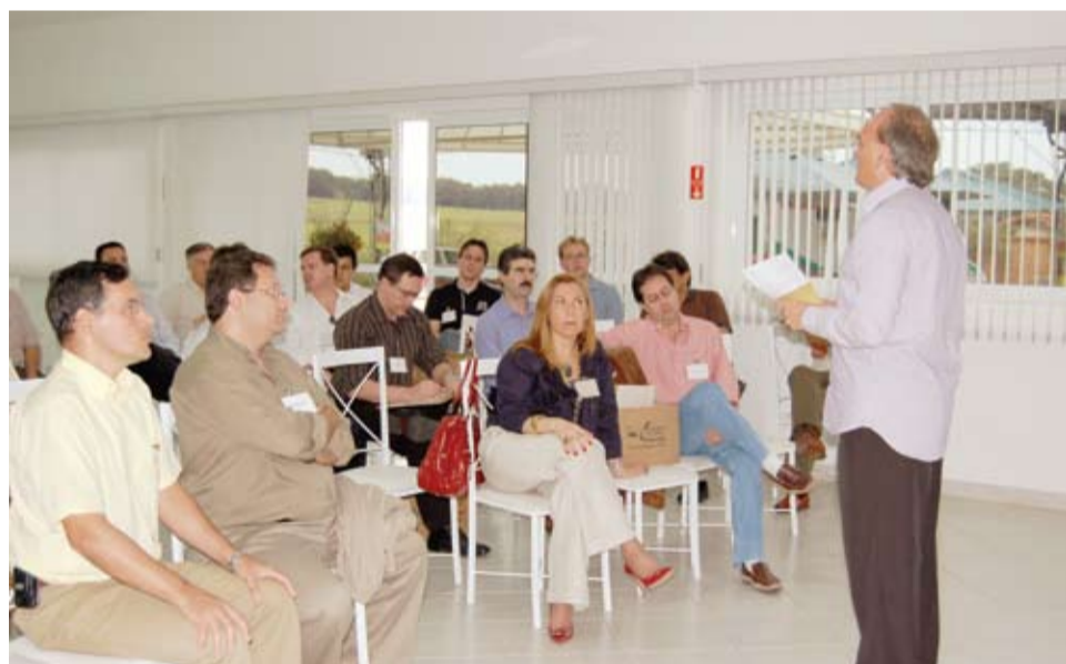
| 1º Vice-Presidente presta contas da atuação da APAMAGIS