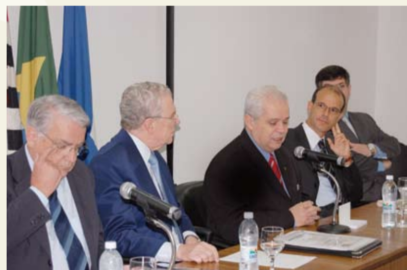
| Presidente Calandra ressalta o perfil constitucional do Judiciário