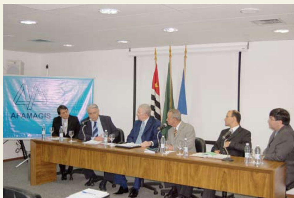
| Des. Caio Canguçu discorre sobre a importância da Constituição Federal

À mesa estavam representadas as áreas cível, criminal, eleitoral e família. Na ocasião, os Magistrados debateram pontos complexos de temas envolvendo essas áreas, que foram mesclados com visões do STF, graças à presença do Ministro Sidney Sanches.