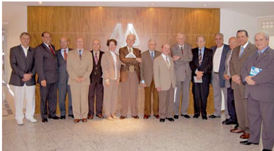
| Presidente Calandra recebe escritores da Academia Cristã de Letras

“Esse ano, em que o Brasil está comemorando 20 anos da Constituição-Cidadã – que são, na realidade, 508 anos desde o dia do Descobrimento, porque o Brasil de ontem é o mesmo de hoje, ele é um país regado pela compreensão, pela generosidade, pelo entendimento e pela fraternidade –, para nós é uma