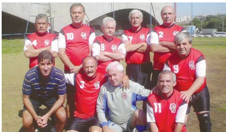
| Jogos foram disputadíssimos