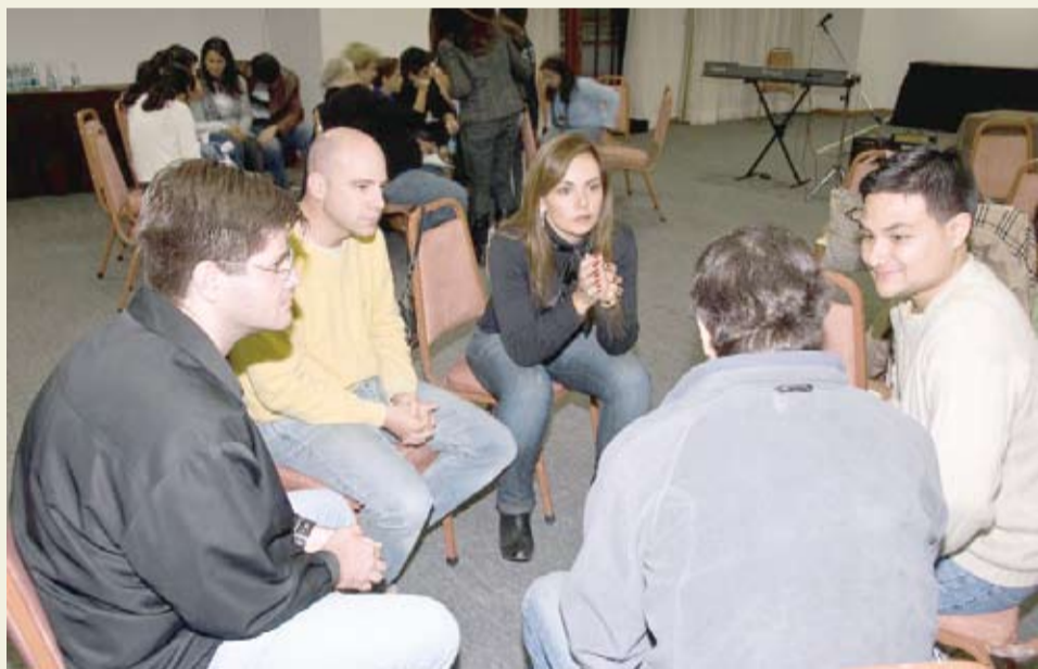
| Magistrados se reúnem para exercitar a fé