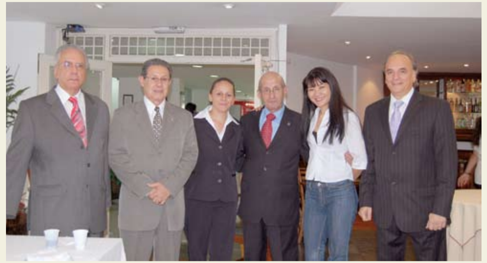
| Des. Amorim e as funcionárias Cláudia e Carla comemoraram o aniversário

Em outubro, o evento “Aniversariantes do Mês” - implantado pela presidência do Des. Nelson Calandra, desde maio deste ano, para homenagear os funcionários da APAMAGIS que fazem aniversário no mês - contou com a participação de um convidado ilustre: o Desembargador Sebastião Luiz Amorim, que completou 74 anos no dia 31 de outubro.