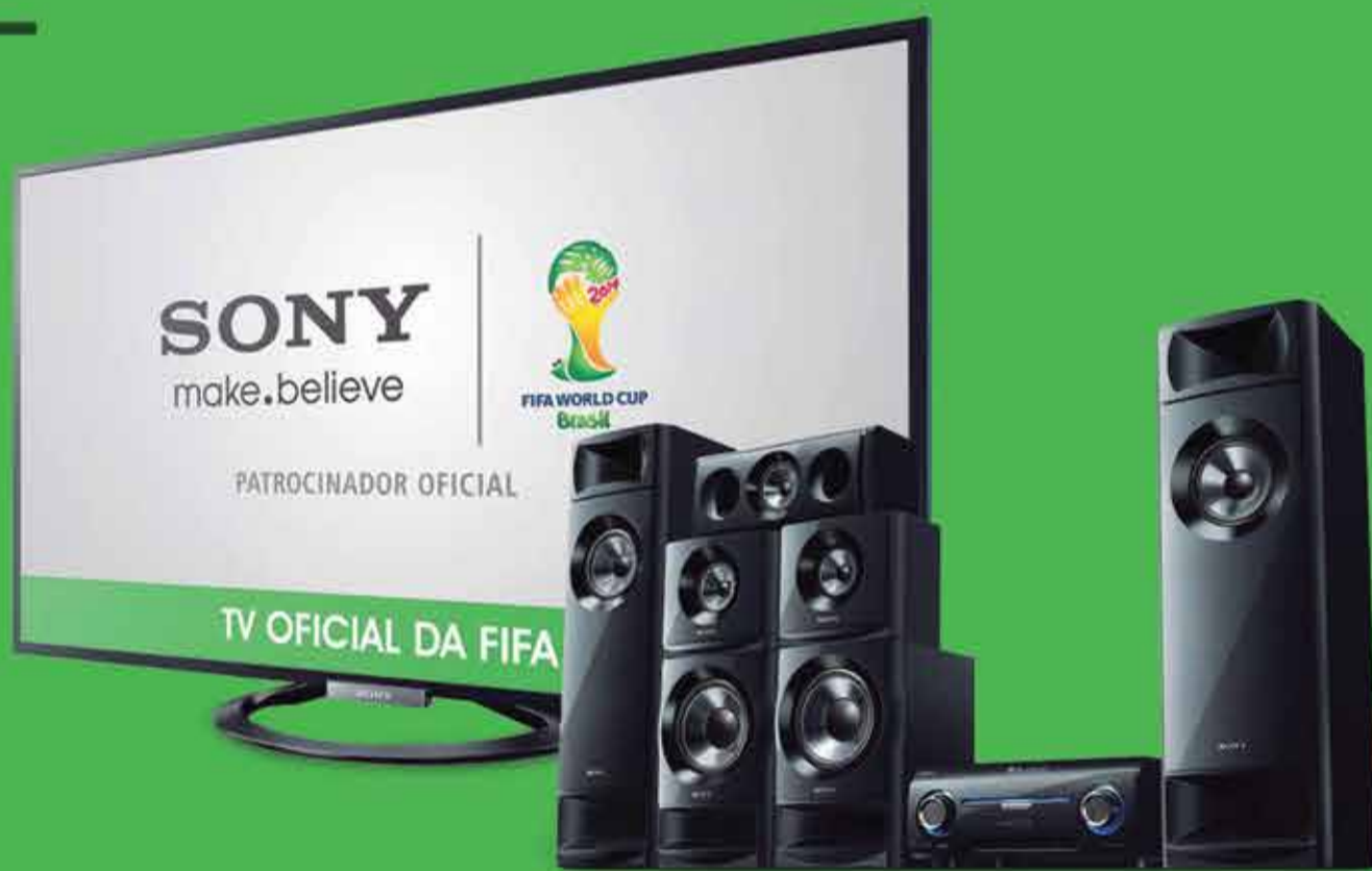
Televisor de LED 50" + Home Theater Sony KDL-50W705A + HT-M3

Para desfrutar desta super vantagem, basta acessar o site store.sony.com.br/parceiros , digitar seu CPF e usar o código promocional APAMAGIS