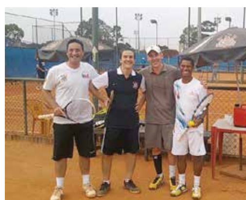
Magistrados conheceram o CT