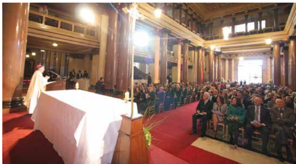
Aproximadamente 500 pessoas participaram da missa