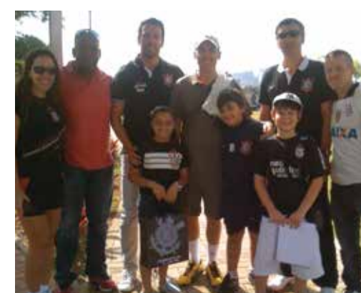
Associados e familiares no Corinthians