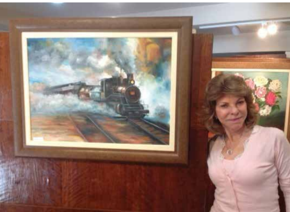
Obras enriqueceram Espaço Cultural da APAMAGIS

Vernissage reuniu Magistrados, familiares e amigos da artista plástica