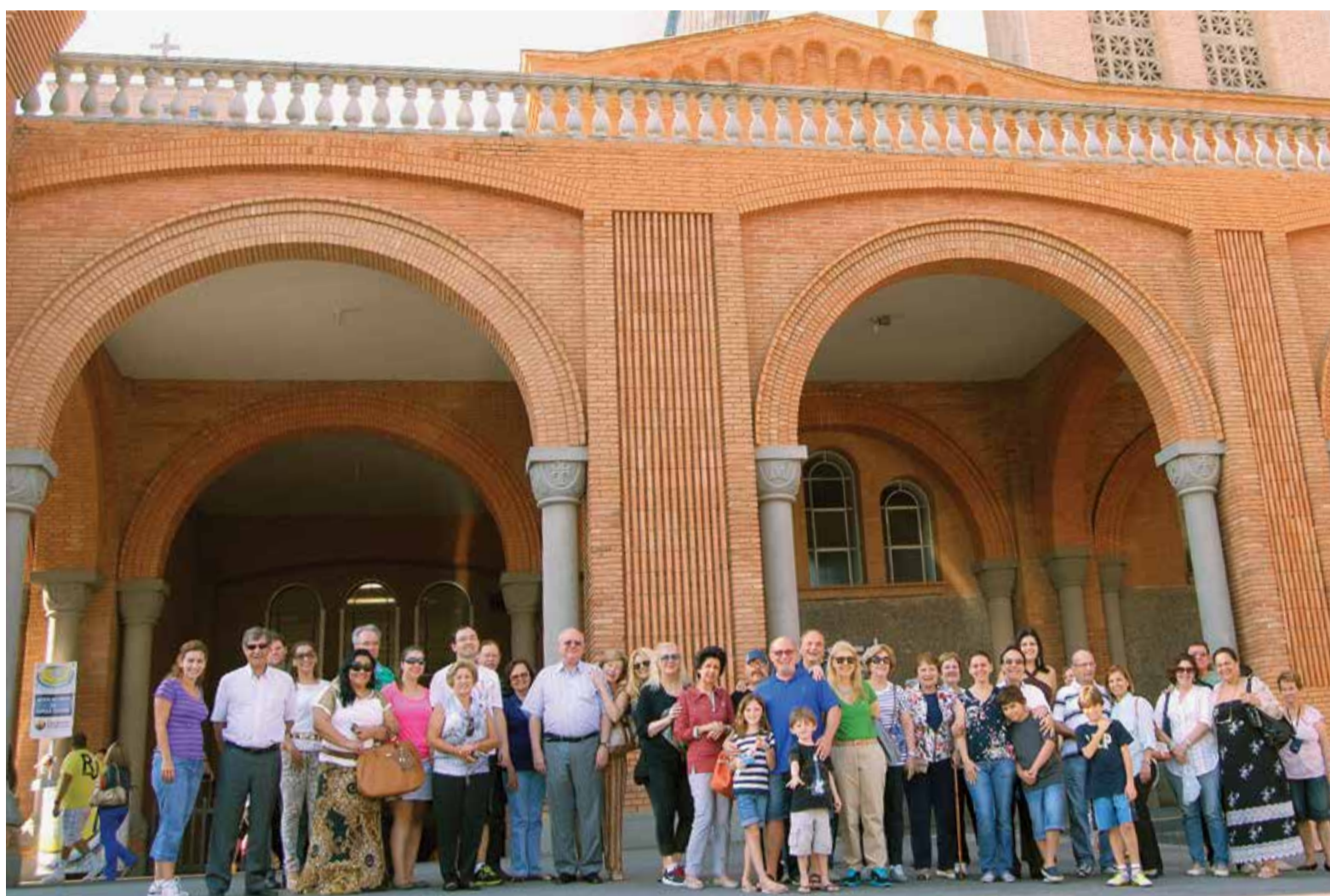
Magistrados e familiares visitaram a Basílica de Nossa Senhora de Aparecida

A Festa de Confraternização da APAMAGIS também já tem data e local definidos: