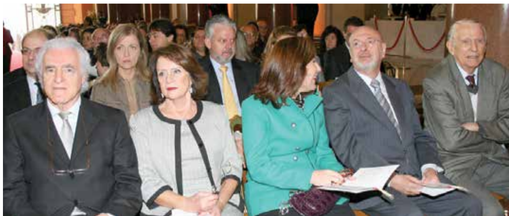
Cúpula do TJ/SP prestigiou o evento

encerrou a cerimônia. “Agradeço ao Sacerdote pela admirável e comovedora cerimônia e, principalmente, à Igreja Católica, que nos renova em tudo, inclusive na sabedoria e nas orientações”.