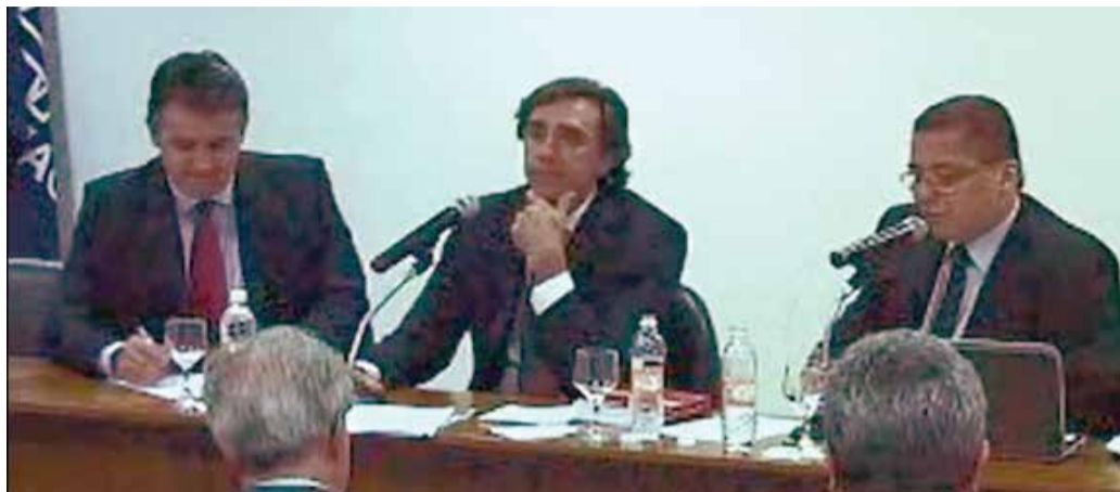
Captura de Tela